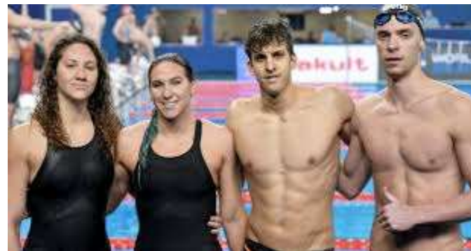
...o in GRUPPO...